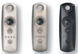
Telis 4 Modulis RTS Pure, Telis 4 Modulis RTS Silver, Telis 4 Modulis RTS Lounge

Manuelle Steuerung eines oder mehrerer Raffstorenantriebe über Scrollrad in Kombination mit dem Funkempfänger Soliris Modulis Slim Receiver RTS.