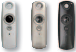
Telis 1 Modulis RTS Pure, Telis 1 Modulis RTS Silver, Telis 1 Modulis RTS Lounge

Manuelle Steuerung eines oder mehrerer Raffstorenantriebe über Scrollrad in Kombination mit dem Funkempfänger Soliris Modulis Slim Receiver RTS.